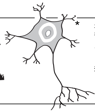
* Neuron moteur multipolaire

LE JOURNAL MURAL DE L'ACTUALITÉ ANTISPÉCISTE