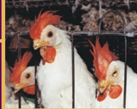
▲ Poulets en batterie (souche USA) dont le bec a été sectionné.

Nous avons donc une double morale : une morale de l'égalité pour les humains entre eux , et une morale inégalitaire et hiérarchique , fondée sur des critères totalement élitistes , à l'encontre des autres êtres sensibles. Tout comme le racisme, et pour les mêmes raisons, le spécisme est ainsi une discrimination arbitraire , et de ce fait, injustifiable. Seul le « droit du plus fort » fonde notre mépris de ce que les (autres) animaux endurent. Ce n'est pas tolérable.