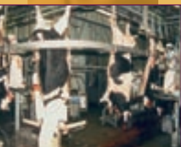
▲ Vaches Abattage.

Réfléchir, informer et mettre un terme aux discriminations arbitraires entre tous les individus (humains compris) : voilà la tâche que se donne le mouvement pour l'égalité animale.