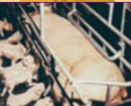
▲ Truies Élevage.