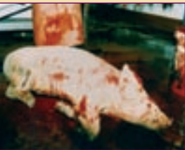
▲ Truie Abattage.