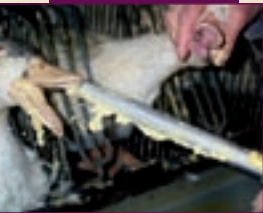
▲ Canard Gavage.